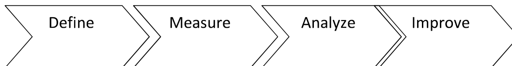
Diagram 1. Siklus Lean Six Sigma

Siklus metodologi Lean Six Sigma (Zornada, 2015) yaitu DMAIC, yang merupakan akronim dari proses sebagai berikut: